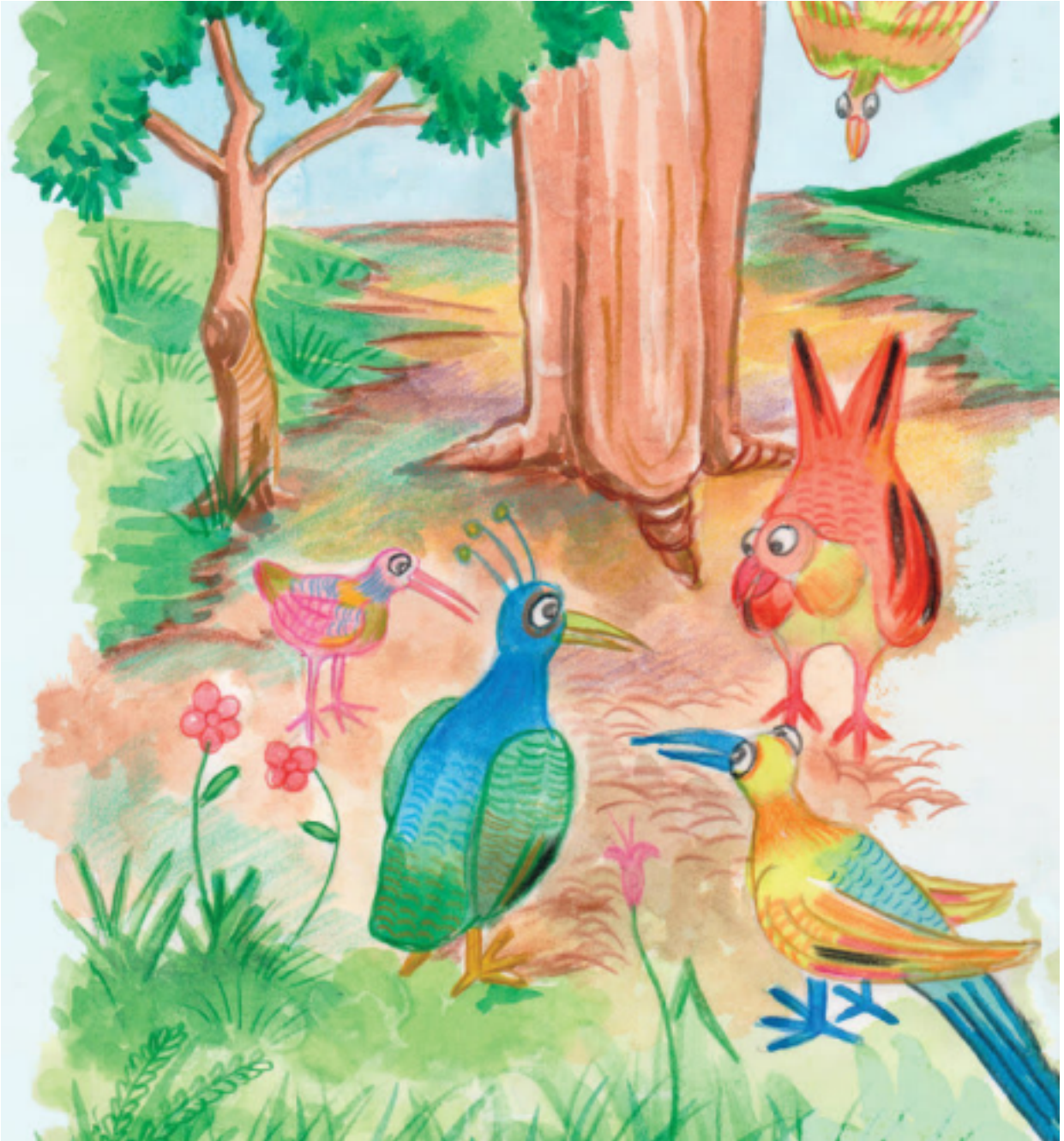
توسی، طاووس مهربان و آرامی بود.