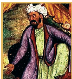
ظهیرالدین محمد بابر