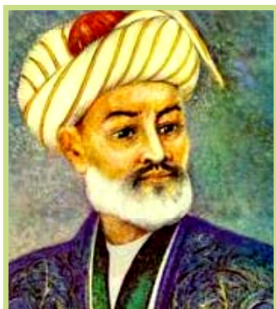
امیر علی شیر نوایی